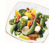
resztki przetworzonej żywności