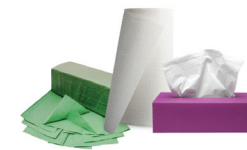
zużyte ręczniki papierowe i chusteczki higieniczne