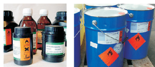
chemikalia i opakowania po chemikaliach