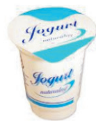
kubki po jogurtach