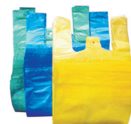
reklamówki i folie opakowaniowe