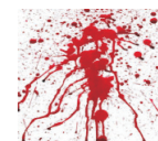
brudny lub mokry papier