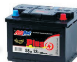
zużyte baterie, akumulatory

PSZOK przyjmuje każdą ilość selektywnie zebranych odpadów komunalnych.