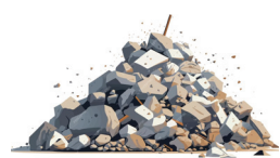
gruz, odpady budowlane