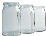
słoiki bez zakrętek