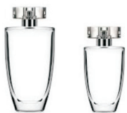
opakowania po kosmetykach