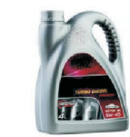
opakowania i pozostałości farb, lakierów i olejów