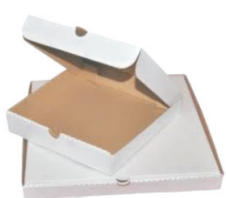
kartony i tektura