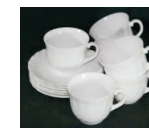
naczynia typu arcoroc