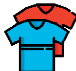
odpady tekstyliów i odzieży